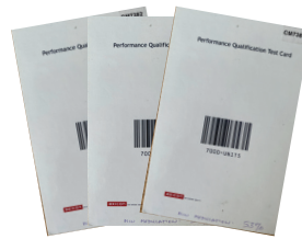
1 jeu de cartes étalons